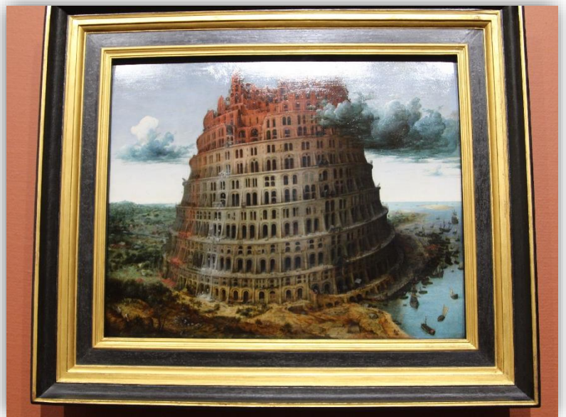
ブルューゲル バベルの とう 塔